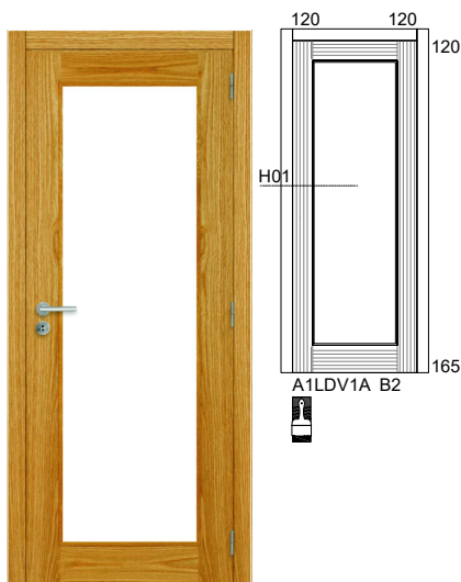
A1LDV1A B2 CARVALHO USA